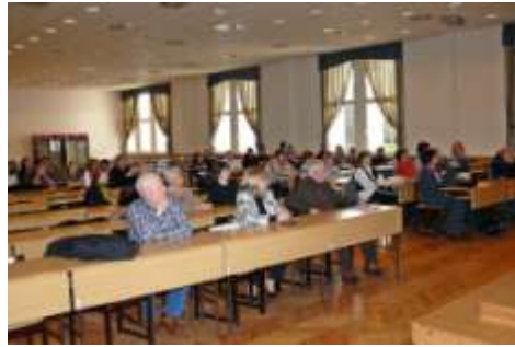
A hallgatóság egy része