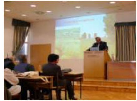
Tájökológiai vizsgálatok és eredményeinek bemutatása c. téma ismertetése

Lóczy Dénes professzor úr elmondta, hogy nem volt könnyű összeállítani az előadását úgy, hogy az a szakmai és a nem szakmai közönségnek is jól érthető legyen. Az előadást követő tetszésnyilvánításból látható volt, hogy a célját elérte.