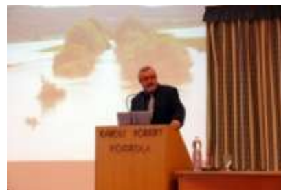
Helyreállítási potenciál tájökológiai értékelése a Dráva ártér magyarországi szakaszain c. téma bemutatása