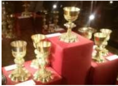
Filigrán díszítésű börtüs kehely (7 db) 1500-1510.