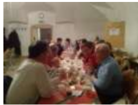
Baráti beszélgetés a terített asztal mellett.