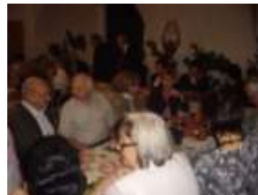
Tagjaink felhívásunkra bőségesen hozzájárultak az étel és italkínálathoz.