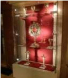
Úrmutató a 16. század elejéről

http://www.mediaklikk.hu/2014/07/20/a-gyongyosi-szent-bertalan-templom-kincstara/