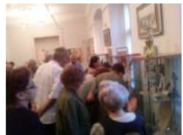
Az előadás után a látogatók megtekintették a kiállítást

A kiállításról készítettünk egy pps-t, melyet csatolunk a hírlevélhez.