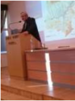
Ártér rehabilitációs kutatások a Kapos és a Dráva mentén című téma bemutatása