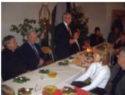
Az elnökség nevében áldott, békés, boldog karácsonyi ünnepeket és jó szórakozást kívánt a szép ünnepi műsorral

Egyesületünk feldíszített fenyőfát ajándékozott a Pátzay János Katolikus Zeneiskolának, amely a rendezvény ünnepi, meleg hangulatát fényesítette.