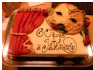
Egyesületünk által ajándékozott díszes torta

Sok sikert kívántunk az elkövetkezendő évekre a társulatnak!